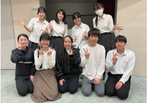
⑤舞台上で生き生きと演じる⑥最後の公演に取り組んだ演劇部員ら

なりました。あと1年で同好会降格か統廃合となったその春、卒業生による部員勧誘動画を見た142期生から4人が入部し、この代の引退で廃部という条件の下、2年間の活動が許可され、新生演劇部として再スタートしました。