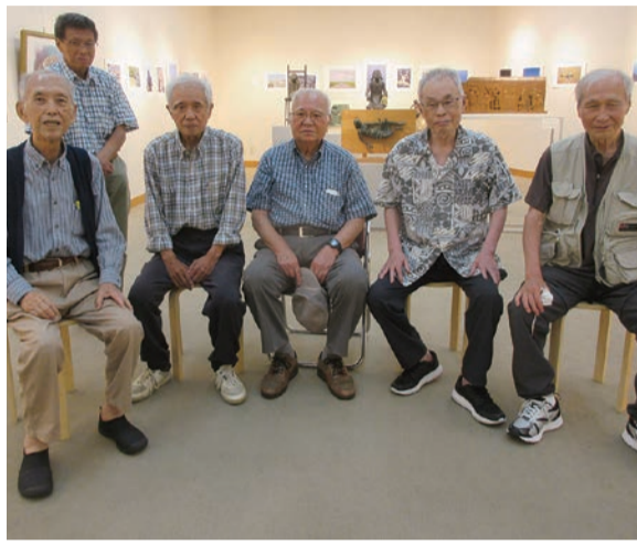
最後の73会展会場に集まった出品者

恒例の73同期会有志による作品展「静岡73会展」が今年で17回目を迎え、静週間、開催されました。参