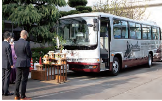
4月25日、静高校舎前で静岡浅間神社によるお祓いを行った納車式

平成16年から20年間にわたり野球部の移動手段として使用してきたバスが老朽化し、いよいよ選手たちの安全を脅かす危険な状況となってきました。このため静高野球部後援会は、野球部・OB会・父母会と協