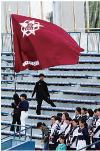
静高-静岡野球定期戦のスタンド

5月6日、ゴールデンウィークの最終日。草薙球場で、静高vs静岡野球定期戦を観戦しました。マーチングから見たのですが、両校とも高校生らしさを表現した特色のある応援を披露し