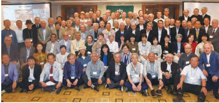
84期同期会に参加した90人

ましよう」と挨拶した。物故者への黙祷、校歌斉唱、その後は記憶をたどり唱、全員での記念写真と進ながらの懇親が進む。