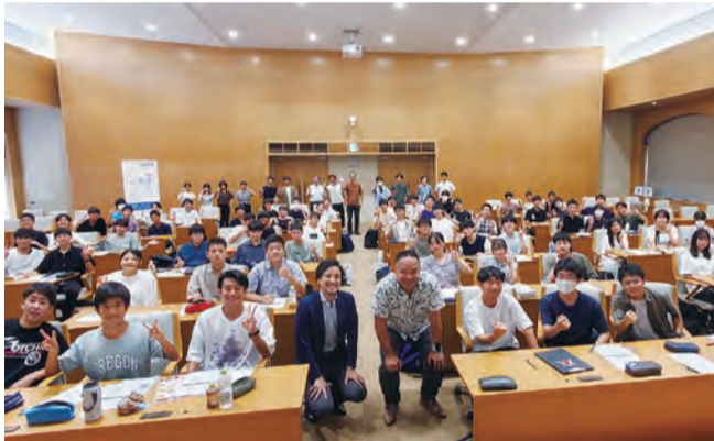
先輩の活躍に学ぶことが多かった「キャリアデザインツアー」の参加者

1、2年生の希望者72人が参加した「静高キャリアデザインツアー」が8月22、23日に行われた。このツアーは、キャリアについての考えを深め、進路選択の足掛かりとする目的で実施している。