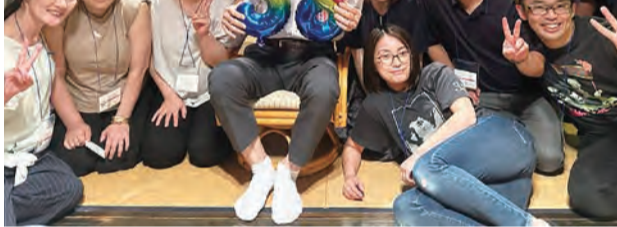
卒業後、初のクラス会は大いに盛り上がった

また、令和6年度の活動計画として年4回の練習支援、新入生歓迎会、年越しそばの会、静大での合同練習会(令和7年2〜3月)が挙げられた。心身ともに現役生の支援をしようという、OB諸氏の思いが