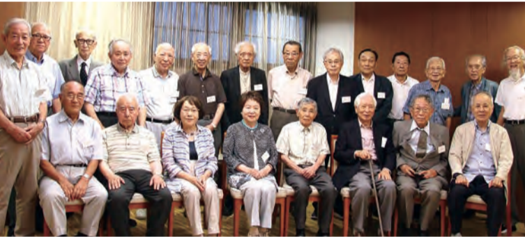
5年ぶりの同期会に県外を含め25人が顔をそろえた

9日の正午に静岡市内の中島屋グランドホテルに参集した。年齢と安全に配慮し、今回は無理のない呼びかけを行い、時間も日中と