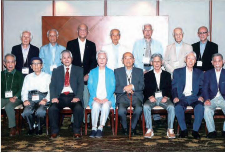
卒寿記念に開催した69期同期会の参加者

9日の正午に静岡市内の中島屋グランドホテルに参集した。年齢と安全に配慮し、今回は無理のない呼びかけを行い、時間も日中と