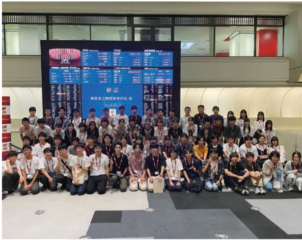
キャリアデザインツアーに参加した1、2年生

1、2年生の希望者68名が8月24、25日、東京へ行ってきました。以前は東大キャンパスツアーという名称でしたが、大学合格を目的にするのではなく、その先のキャリアまで考えさせたいという思いから内容と名称を見直しました。東京証券取引所では、東