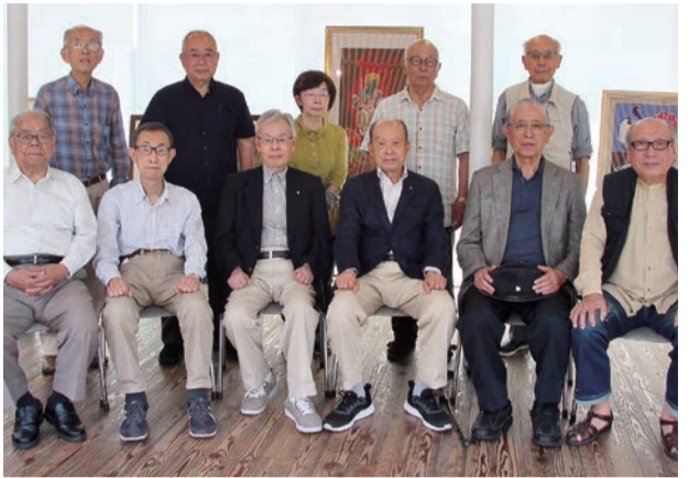
会場に集まった第25回静高アートクラブ展 in 印高館

母校の印高館を会場に毎年開催している静高アートクラブ展 in 印高館は6月7-11日、学校と同窓会の協力を得て開催しました。第25回となります。例年は現役の皆さんの印高祭に協賛するという形で開催