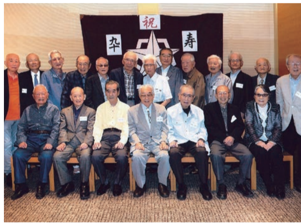
遠く福岡を含め20人が出席した68期同期会

68期が卒寿を迎える年で、健勝を祝う会を6月8日、静岡市のホテルグランヒルズ静岡で開催しました。昭和21年、入学した旧制静岡中学は戦災で長谷校舎を消失し、駅南の仮校舎で、後に二転して落ち着いた先は駿府城跡の旧兵舎を改造した教室でした。そして、中学2年進級の時、学制改革で新入生の募集が以降3年間無く、高校2年に進級して初めて下級生を迎えました。完成間近の長谷の新校舎を横目で眺め、新制城内高