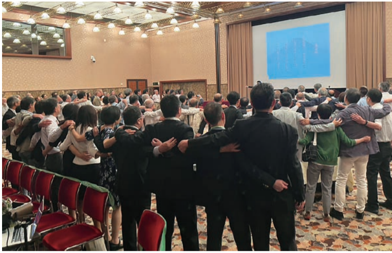
関東同窓会の総会参加者は懇親会で肩を組んで高らかに校歌などを歌った