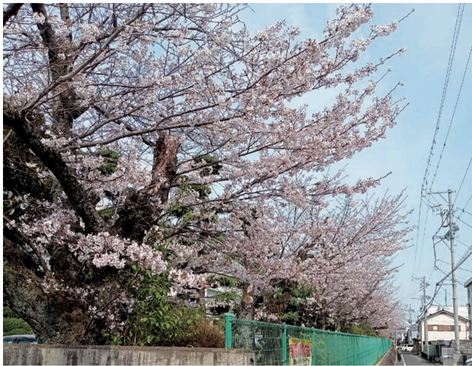
満開になったフェンス沿いのソメイヨシノ