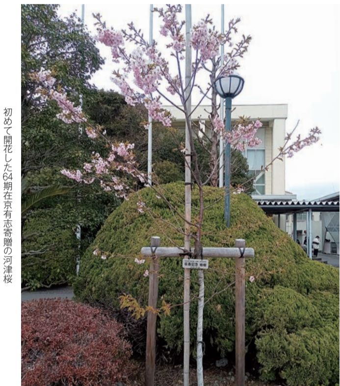
初めて開花した64期在京有志寄贈の河津桜

静岡地方気象台が今年の桜の開花を発表したのは3月21日。それより1週間ほど早く、静岡のソメイヨシノはちらほらと花をつけ、河津桜が初開花した。合格発表日であったこの日、合格掲示板を見に静高を訪れた多くの中学生に、桜が気を取られた。高松入試は30輪以上が花開いた。高松入試は30輪以上が花開いた。高松入試は30輪以上が花開いた。