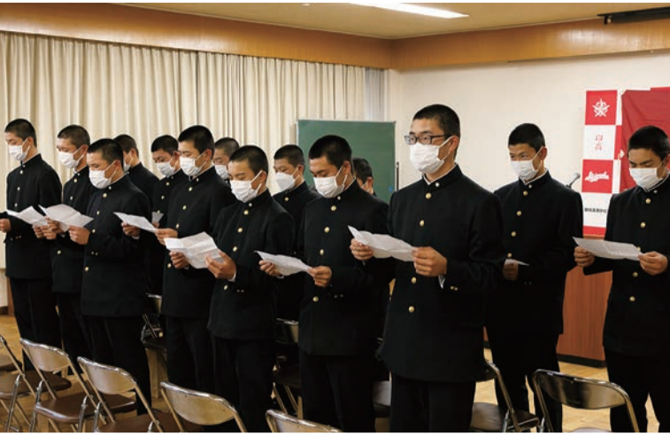
野球部後援会総会で整列した新入部員