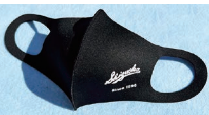
↑2022年度正会員証 後援会オリジナルロゴ入りマスク

2022年度の静高野球部は15名の新入部員を迎え、3大会連続の夏の甲子園へ挑みます。本後援会は、野球部のひたむきな日々の鍛錬とさらなる飛躍を支えるため、引き続き物心両面からサポートをしてまいります。一人でも多くの皆様に後援会にご加入いただき、ともに野球部の発展にご尽力くださいますようお願い申し上げます。