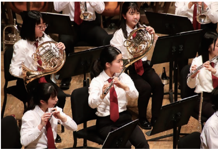
吹奏楽部の定期演奏会