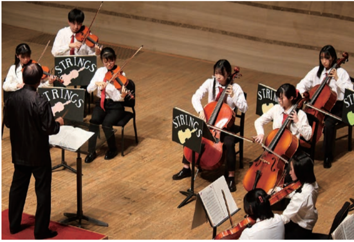
弦楽合奏部の定期演奏会