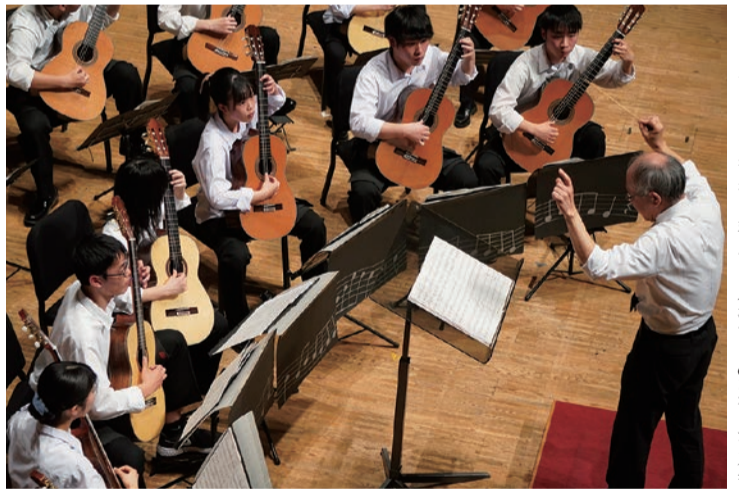
クラシックギター部の定期演奏会