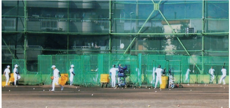
新入部員を迎え、夏の甲子園を目指して練習に一層力が入る野球部員たち