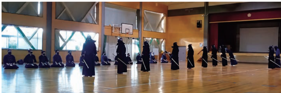
新年合同稽古会にOB・OGと現役部員らが参加し熱気に包まれた