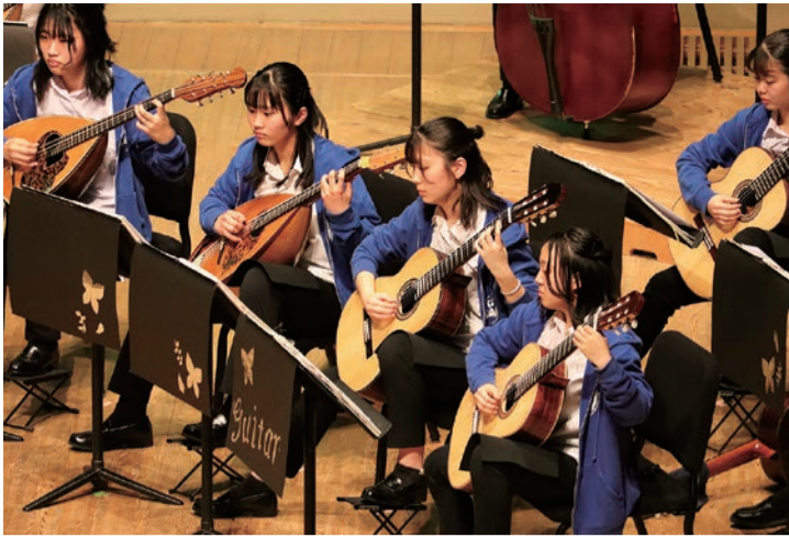
マンドリン部の定期演奏会

地元の静岡大学には現役14名、過年度生1名、静岡県立大学には現役5名、過年度生3名が合格し、国立