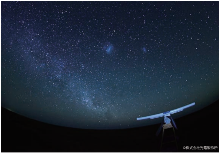
写真1 南半球の天の川と筆者らが組み立てた追跡用マリンレーダー

気温50度の厳しさ 日本から続く4週間ホテ ルの隔離を終え、なまりき った身体に、次に待ち受け ていたのは気温50度に達す る、南半球最大のフィー ルドを相手に、リーダーや メンテナをセットアップし ていく。10分おきに給水休 憩をとっても熱中症で倒れ る人がいた。強風で倒れた メンテナをハンマーで直した り、スタックした4WDを 押し下ろし、タイヤ交換した ことも。エアコンがない時 代、この人々にはあまりの 暑さに洞穴を掘って生活し た。私が宿泊した場所は、 炭鉱会社のプレハブ小屋で きた小さな集落だった。 集落といっても飛行場や イルやバー、食堂が併設さ れ、作業員が近隣のアドレ イドから1時間で通勤でき るよう整備された綺麗な 場所だ。そこを拠点に毎日 往復300km以上フィールド を4WDで移動し、1カ所 1カ所、リーダーII写真1 IIやアンテナを組み立てて いった。最初の1週間 移動距離は約2000kmを 超えた。その後、ヘリコ プターによるGPSの校正、 本 リハーサル運用を終え、本