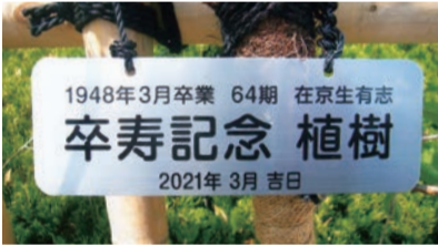
河津桜に掲げられたプレート