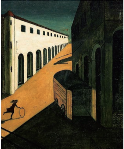
キリコの油彩画「通りの神秘と憂鬱」(1914年)

対象と向き合い、アート(落書き)を残す。思えば、建築も絵画も表やくような感覚だったり、現しようとしたものはいつた世界に「形」についてであった。人々が求める理想性であったりする。ヴァーや平和、時には批判や批評が求められる形にすることを目指す。それが自ら否定するようである。その際の主題(テーマ)はさまざまだが、平和である。