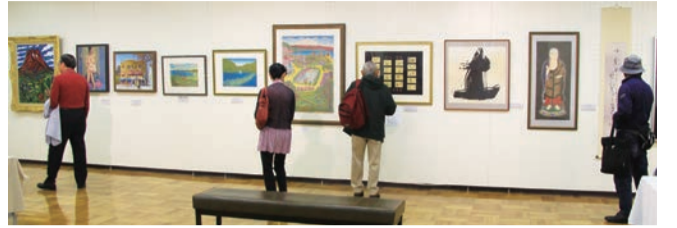
熱情あふれる作品が並んだ会場