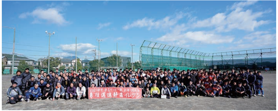
サッカー部OB会の初蹴りの会には現役も含め250人以上が集まった