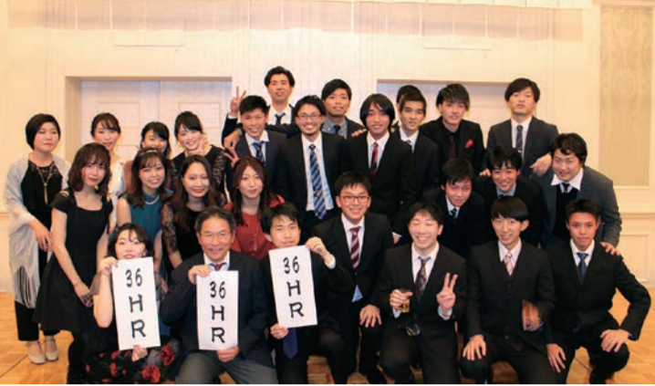
卒業6年目となる130期の仲間が多数参加し、青春の舞台だった静岡の思い出を語り合った

130期の卒業6年目の会(卒6の会)が1月2日、静岡市駿河区のホテルセンチュリー静岡で開催された。卒業から6年、日本全国のさまざまな環境で生活を送る仲間が一堂に会し、忘れられない日となった。2時間半と短い宴会ではあったが、昔話や卒業後の話で笑い合い、肩を組み合った仲間は、いつまでも南健児であることを確信するのには十分であった。それぞれ別々の道を行っていても、皆の言葉や表情にはあのころと変わらぬ情熱と