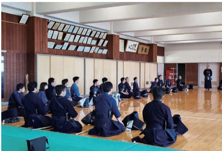
37名が防具を着けて稽古。熱気であふれ返りました。し、新春の道場は気合いと見学者からは「剣道から遠く素晴らしい新年のスタートとなりました。」

剣道部OB・OG会(洗心会)は新年の卒業生・生徒合同稽古会を1月3日午後、静高剣道場で開きました。 稽古会には生徒、顧問、卒業生のほか、剣友の方々と保護者計50名が集まりました。