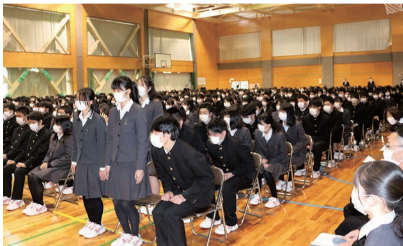
全員がマスク姿、出席者も限定して行われた異例の卒業式