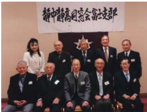
野球の話題や昔話に花が咲いた富士支部総会の出席者