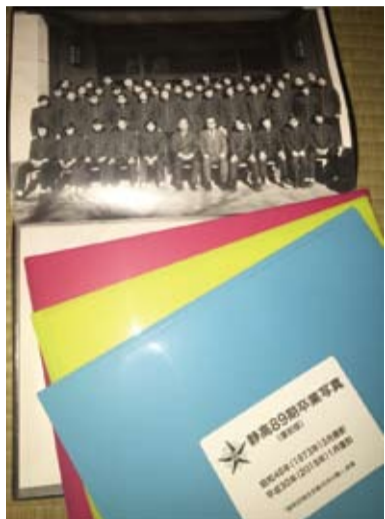
出席者を喜ばせた新たに作成の「卒業アルバム」

89期「卒業四五年の集い」が一月三日、静岡市で開かれました。今回は33日Rが幹事を務め、九五名が集まり、三年前の還暦同期会に並ぶ盛大な会となりました。