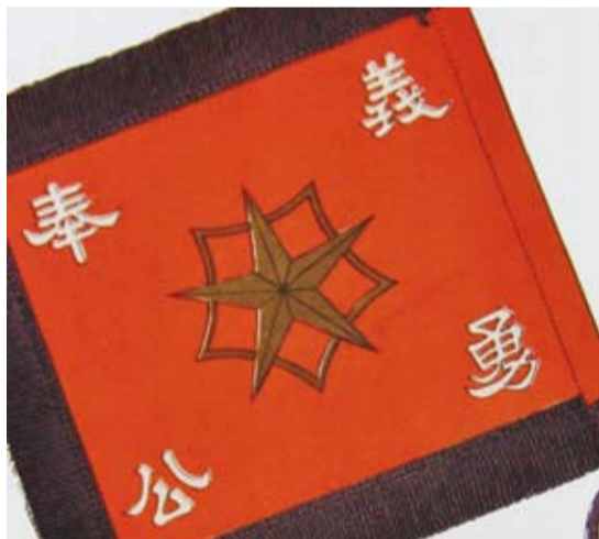
写真② 静岡中学時代の初期校旗のイラストとみられる

静中静高校歌二番に唐紅の旗印とあります。唐紅は言うまでもなく静高のシンボルカラーです。以前から同窓会旗や校旗の色に、あれが紅色かと疑