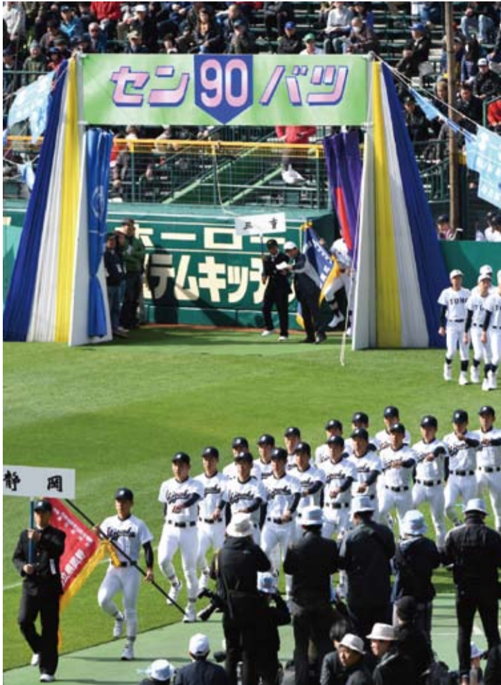
2年連続でセンバツ出場を果たした静高ナインは開会式の入場行進で堂々とした 行進を見せた= 3月23日