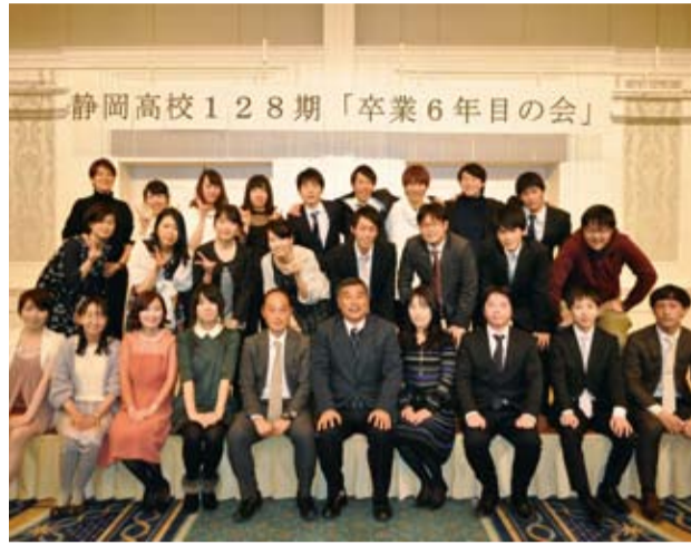
卒6の会に128期の多くが出席し思い出話などで楽しく過ごした