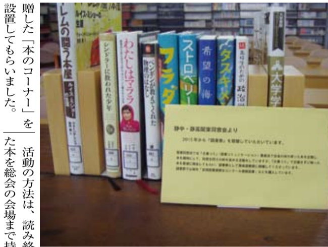
静岡図書館に備えられた、関東同窓会寄贈図書券で購入した書籍

関東同窓会は二〇一四年度から、「読み終えた本の寄付・交換」を通じて母校との繋がりを、また同期とともに同窓生との繋がりを深めるという「古書コミ(コミュニケーション)活動」を行っています。回を重ね、七月の総会と二月の各期幹事会の年二回を継続して計八回になりました。