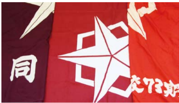
写真① 左から同窓会旗、校旗、73期の旗