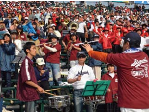
対東海大相模戦で熱のこもった応援を繰り広げた静高側スタンド = 3月29日