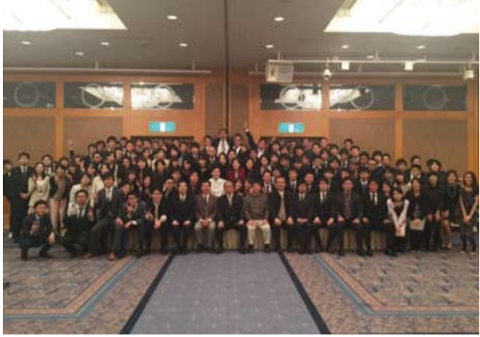
結婚や子供の話、仕事の話と会話が弾んだ「卒10の会」出席者たち

紺碧の天空はどこまでも 碧く、遙か彼方におわしま す蒼き富士の山も優しく祝 福してくれるかのような晴 天の二月二日、112期の「卒業 二〇年目の集い」が静岡市 のホテルセンチュリー静岡 で行われた。奇しくもこの 日、同ホテルでは同窓生に