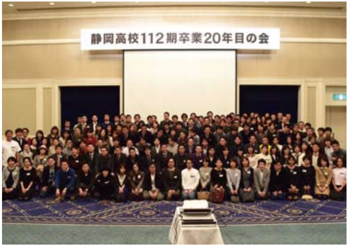
150人を超す同期が再会を果たした「卒20の会」