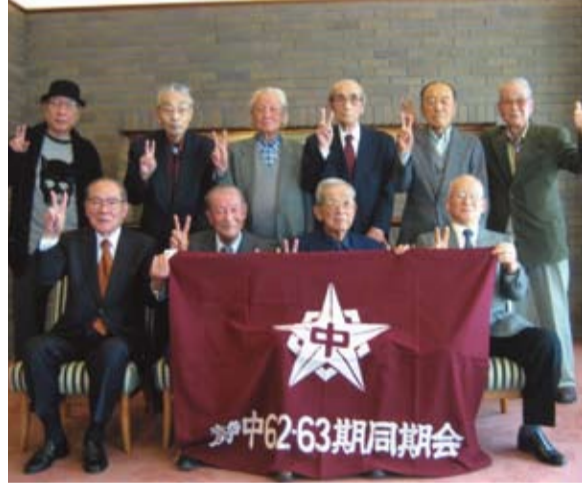
東京で最後の開催となった62・63期関東同期会