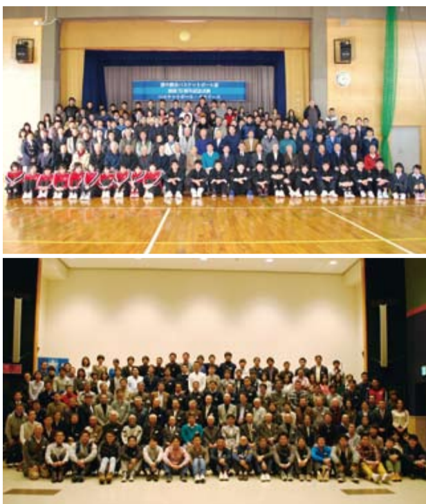
④バスケットボール部創部75周年記念式典の出席者 ⑤祝宴参加者の記念写真