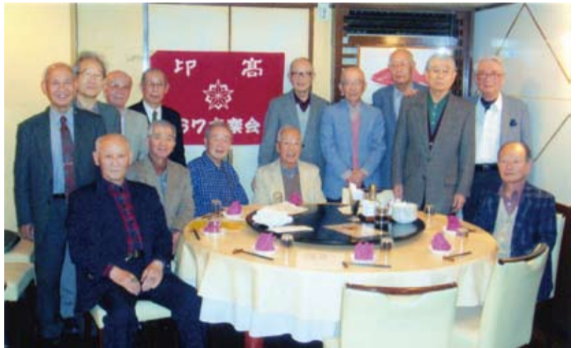
67期の14人が元気な姿を見せた