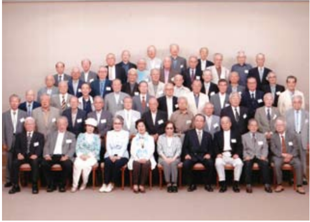
野球談義もあって盛り上がった68期懇親会

「継続は力なり」と、68期の懇親会は毎年開催です。今年も五月二日、静岡市のホテルセンチュリーで開催されました。