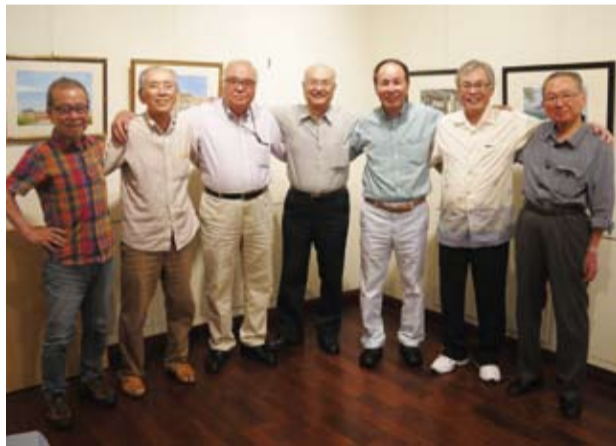
ユニークな作品展となった7回目の73会展出品者たち

静岡高31人会に合わせて同期有志10人による作品展「静岡高73会展」がギャラリー「ワタナベカメラ」で開催されました。