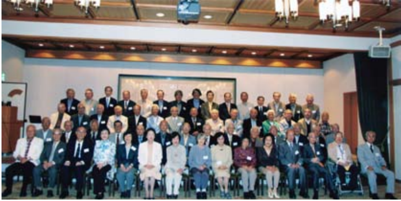
女性8人を含む61人が元気に集まった70期同期会