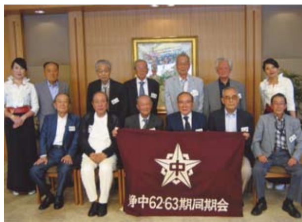
静中62・63期同期会参加の11人

の任意の親睦情報交換の集いとなるものと期待されています。 開戦後間もない昭和一七年四月に入学した私たちは、軍事教練や勤労奉仕に忙しく、終戦までの一年有餘は軍需工場に学徒動員され、この間予科練、予科兵学校などに馳せ参ずる人も多かったです。戦後は仮校舎を転々とし、学制の変動で四年で卒業の62期、五年卒業の63期と分れました。しかし、戦中戦後の苦難の