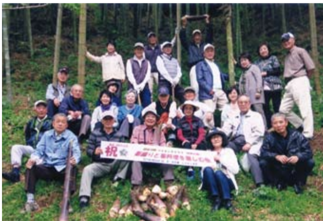
筍掘りと筍料理を楽しんだ74期の山遊会メンバー

今年で74期ハイキングクラブ「山遊会」が結成されて六周年となります。そこで、特別企画としてメンバー