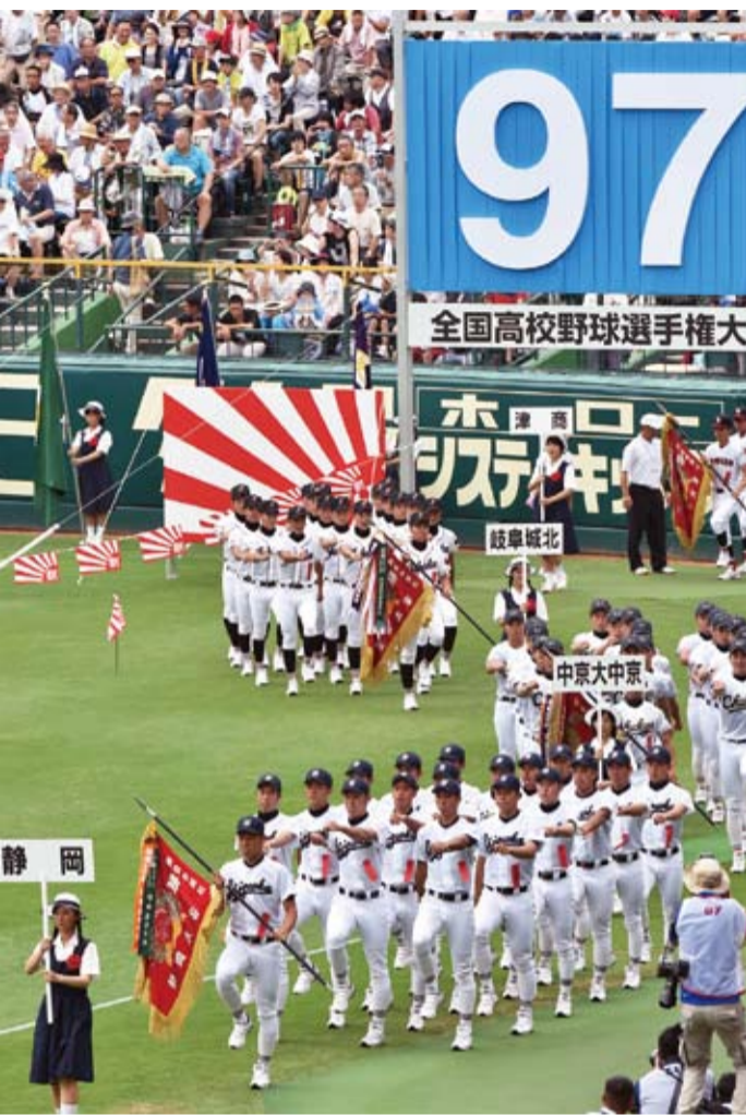
3季連続で甲子園出場を果し、堂々の行進を見せた静高ナイン=8月6日の開会式