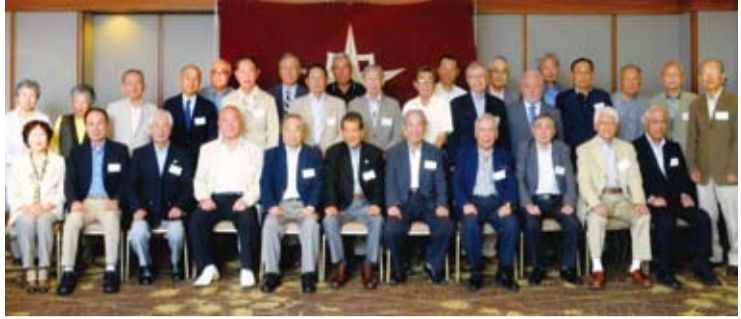
受章祝いを兼ね31人が集まった