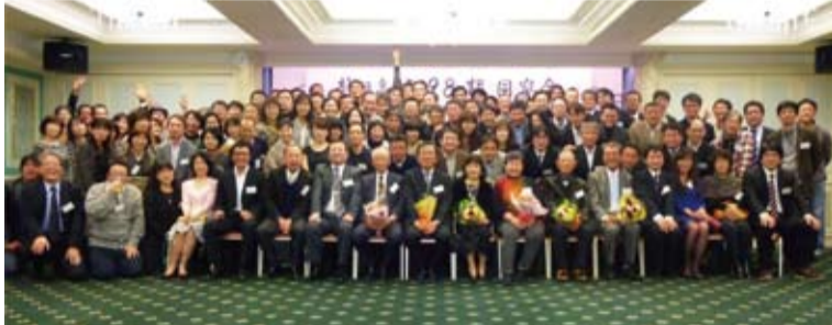
久しぶりの再会に多くの同期生が集まった