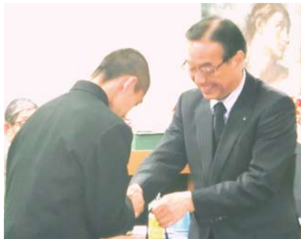
新入部員を励ます木内後援会長

平成二六年度の静高野球部後援会総会は四月十九日、こぞ甲子園出場を」と熱気同窓会館で開催された。ちようど一週間前の十二日には、春季中部地区大会の決勝に勝って第一位で県大会