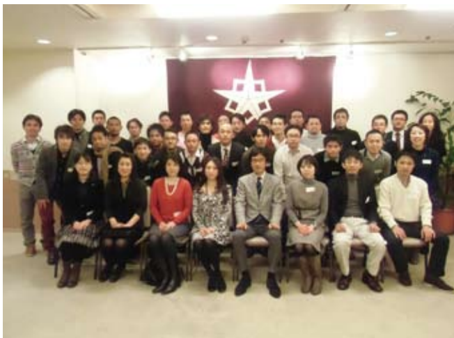
出席者多数で3回に分けて行った記念撮影