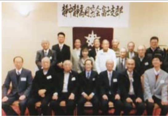
期を越えて交流した富士支部

先生のお話も遠方より駆けつけてくださり、お元気な姿と、すばらしいお言葉を頂戴することができました。これからも同期会を開催し、楽しい時間はあつと、いく予定です。