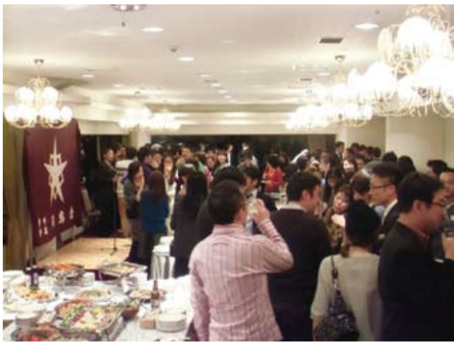
120名以上が参加し大盛況だった卒業20年の会