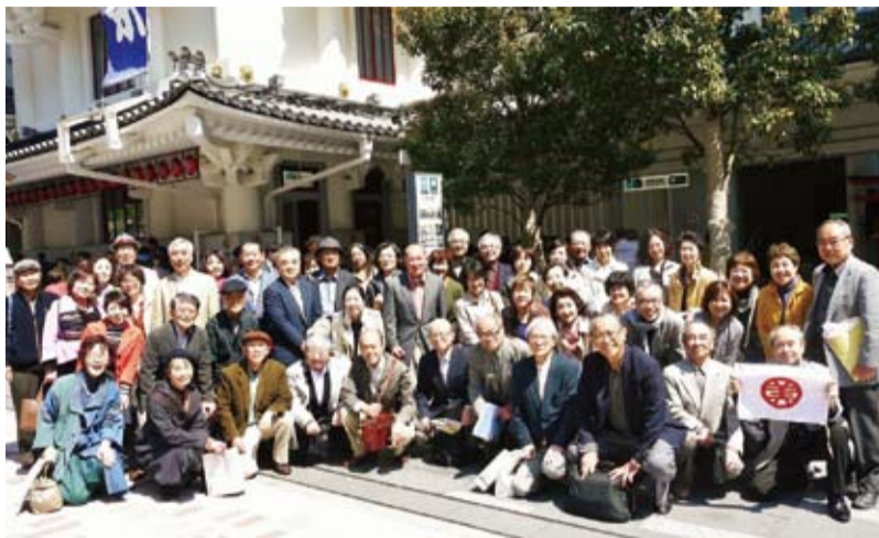
歌舞伎と美術展を楽しんだ参加者