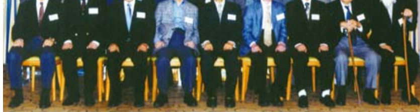
元気な顔が揃った61期の同期会

卒業の時の時とはまた違った、様々な道を歩んですっかり大人になった旧友たちと、昔と変わらない友情を確かめ合うことができた今回の同窓会。あの頃は言えなかったことも今だから話せたり、音信不通になっ